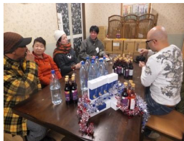
写真上：右よりボランティアへの説明会の様子、高田地区での集会所、米崎地区の仮設住宅で 写真下：竹駒地区でのパーティの様子