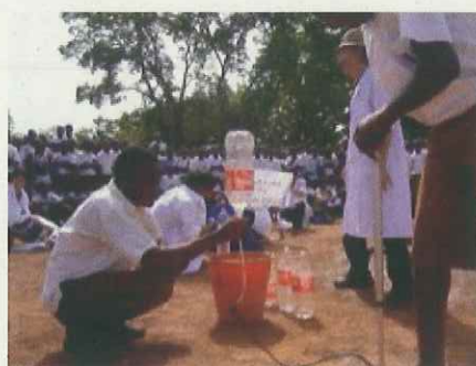
(JICA ボランティアによる実験ショー)