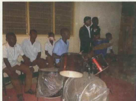
(クリスマスキャロル)

このように本校の生徒は勉学に励む一方で、スポーツ、ダンス、音楽なども楽しんでいます。